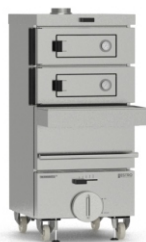
ESTRO pro 2 2 гриля

Печи ESTRO PRO и ESTRO PRO+ - это многоуровневые печи на древесном топливе, которые гарантируют безопасность на Вашей кухне, экономию места, а главное, в процессе приготовления сохраняют натуральные свойства продукта.