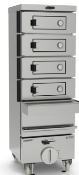
ESTRO pro 4 4 гриля