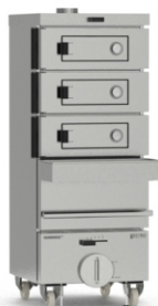
ESTRO pro 3 3 гриля